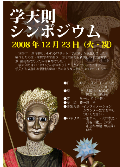
写真5. シンポジウム案内ポスター

今回の学天則シンポジウムでは、年末の忙しい時期ということと宣伝不足もあり、参加者が少なかったのが残念であったが、講師・パネラーのみなさんの協力により、充実した内容となった。この場を借りて感謝申し上げます。