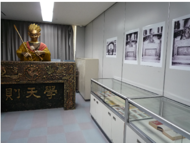
写真4. 小型の学天則模型や関連資料